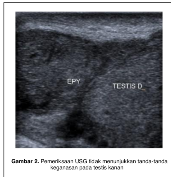
Gambar 2. Pemeriksaan USG tidak menunjukkan tanda-tanda keganasan pada testis kanan